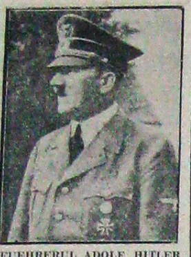
FUEHRERUL ADOLF HITLER

VIENA, 20 (Radior). — Aderența Ungariei la pactul tripartit s'a produs Miercuri în cadrul unei mari ceremonii de stat.